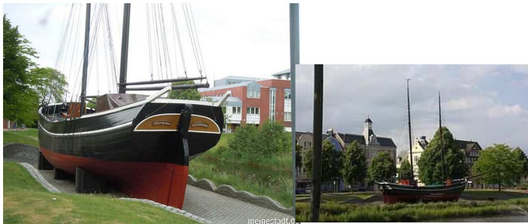
Frachtsegler Hermine in Cuxhaven

Es besteht die Möglichkeit die Klostersande in das Hafenbild an Land einzubinden, ähnlich der Gestaltung in Cuxhaven. Hier liegt eine Kogge.